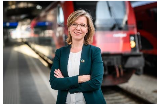
Leonore Gewessler, BA Bundesministerin für Klimaschutz, Umwelt, Energie, Mobilität, Innovation und Technologie

Die eingeleitete Organisationsreform in der Bestellung gemeinwirtschaftlicher Leistungen wurde im Jahr 2019 fortgesetzt. Nachdem mit Fahrplanwechsel Dezember 2018 neue Verkehrsdienstverträge im Nahverkehr für Vorarlberg, Steiermark und Kärnten mit der ÖBB-Personenverkehr AG abgeschlossen werden konnten, erfolgte mit 15. Dezember 2019 die Systemumstellung auch in den anderen Regionen (Ostregion, Oberösterreich, Salzburg, Tirol) sowie für den Fernverkehr.